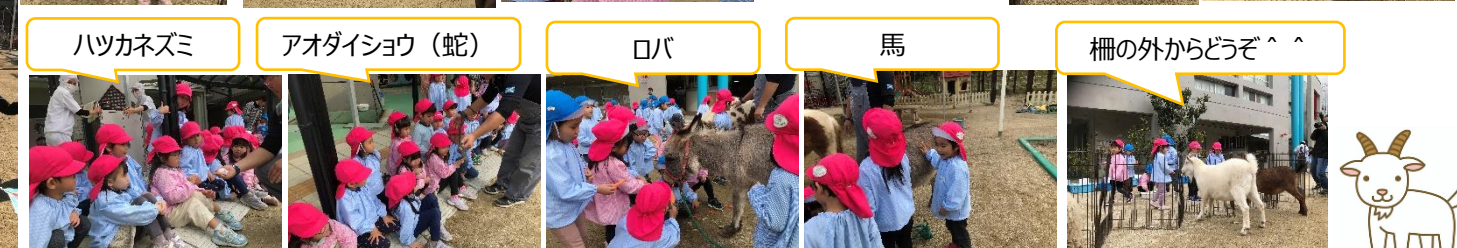
柵の外からどうぞ^^